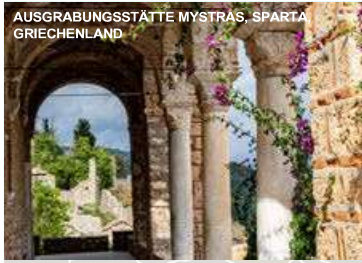
AUSGRABUNGSSTÄTTE MYSTRAS, SPARTA GRIECHENLAND