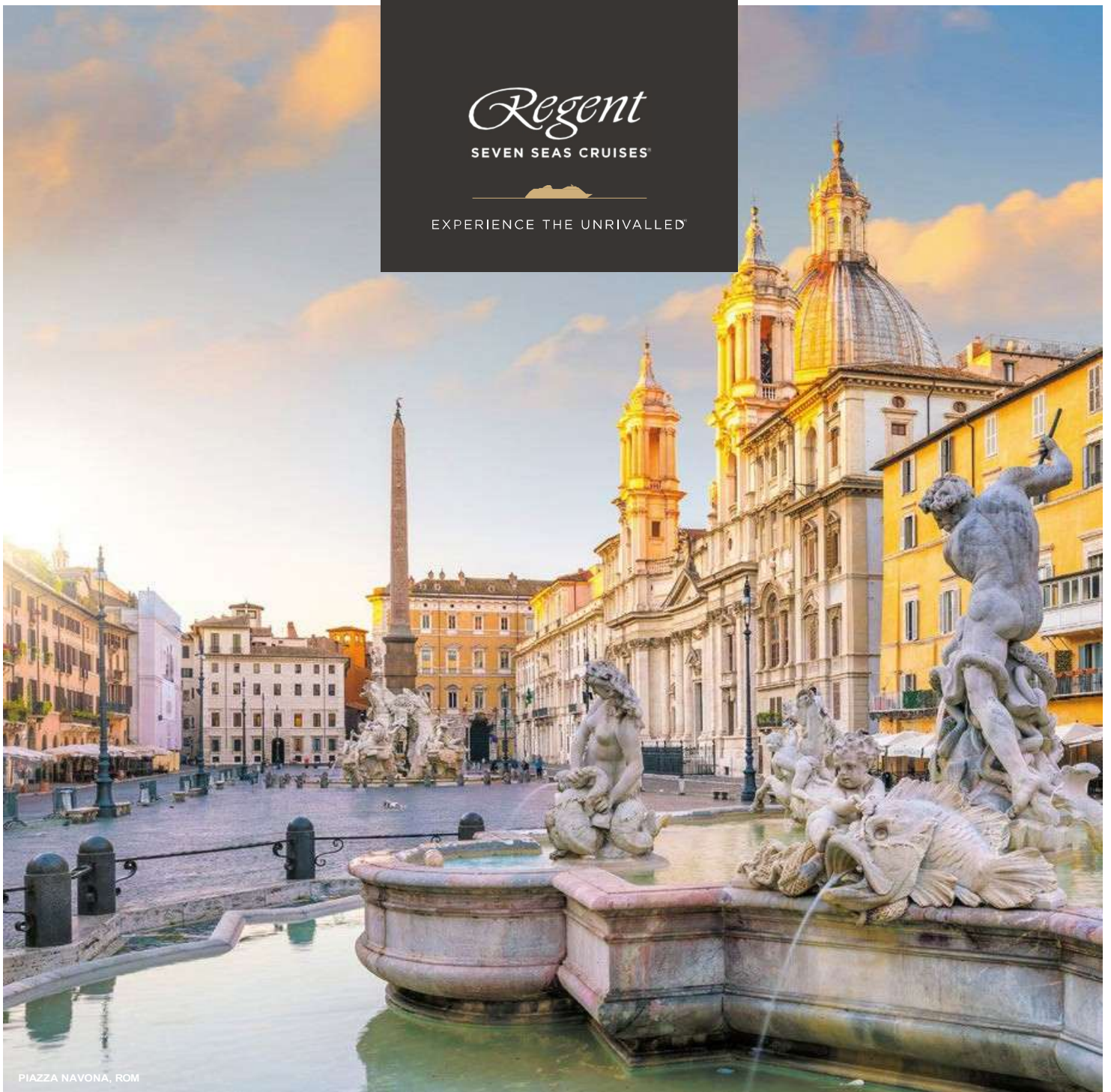
PIAZZA NAVONA, ROM